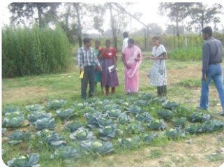
காய்கறி ஆராய்ச்சி திடல்