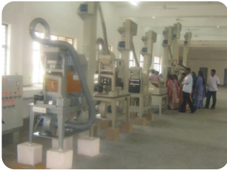
விதை சுத்திகரிப்பு மையம்