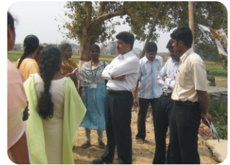
வயல் வெளி கலந்துரையாடல்