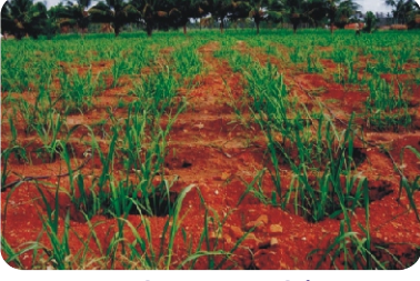
குழி முறை நடவில் சொட்டு நீர் பாசனம்