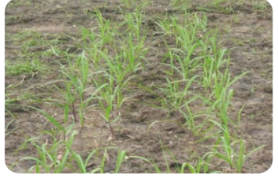
இரு சால் நடவு