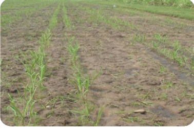
ஒரு சால் நடவு