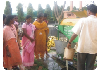
சுத்தரியில் விதை பிரித்தெடுக்கும் இயந்திரம்