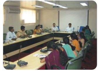
தேசிய விதை ஆராய்ச்சி மற்றும் பயிற்சி மைய இயக்குனருடன் கலந்துரையாடல்