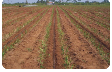
இணை வரிசை நடவில் சொட்டு நீர் பாசனம்