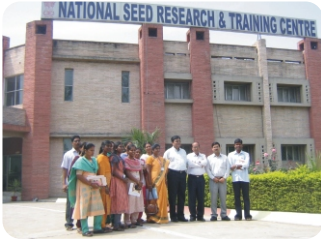
தேசிய விதை ஆராய்ச்சி மற்றும் பயிற்சி மையம், வாரணாசி